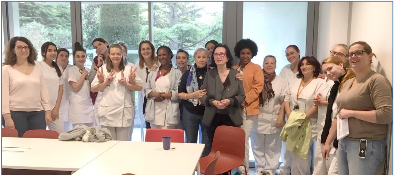
Café-Info de Saint Dominique (10/4/19) :