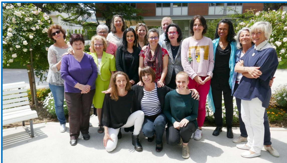
25/5/19 FC – K.TESSON – Information sur la Thérapie des Champs Mémoriels