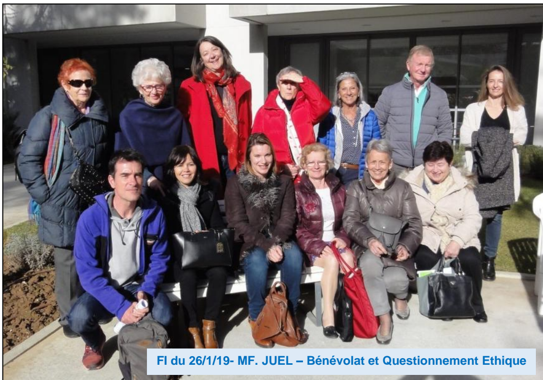
FI du 26/1/19- MF. JUEL – Bénévolat et Questionnement Ethique