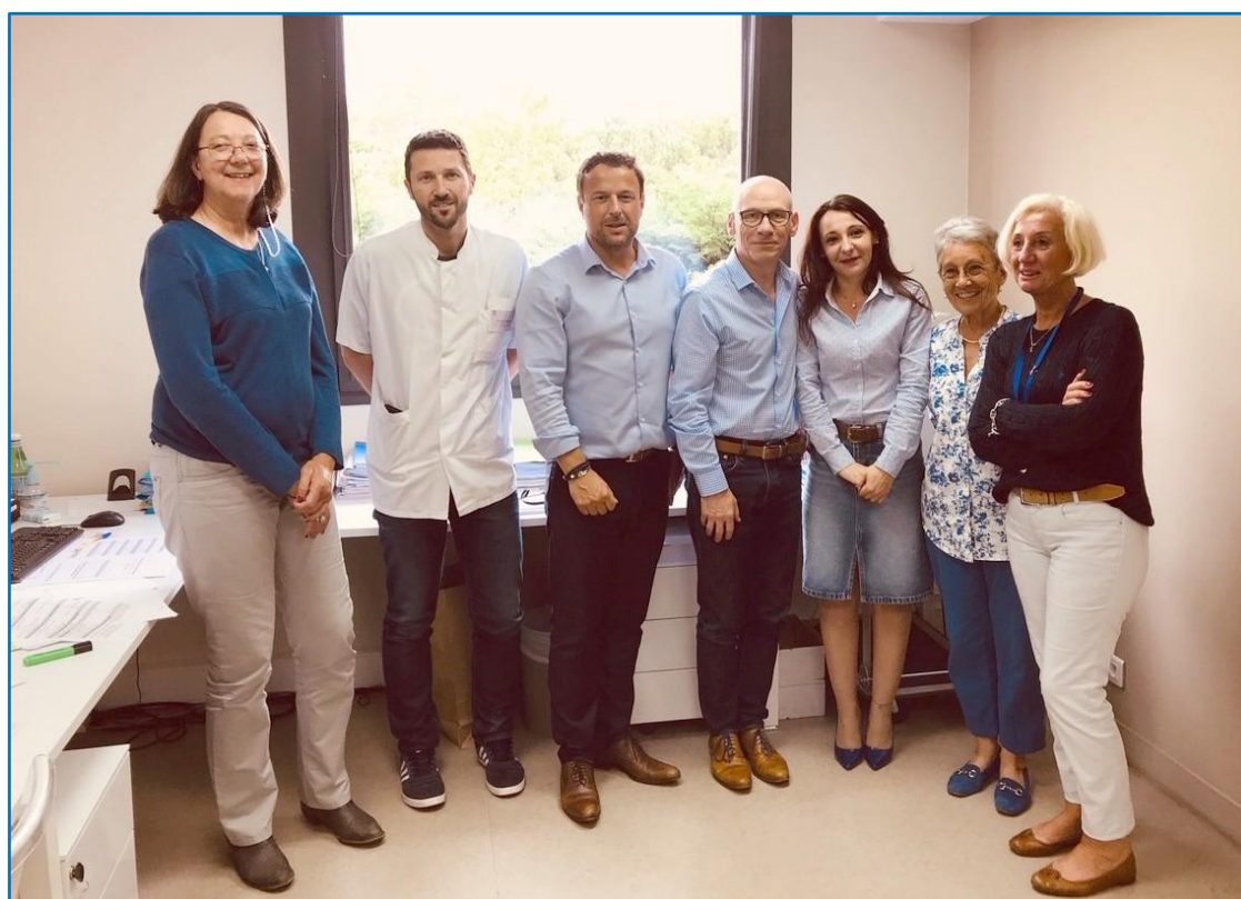
Bilan à la clinique Plein-Ciel le 24/5/2019 :