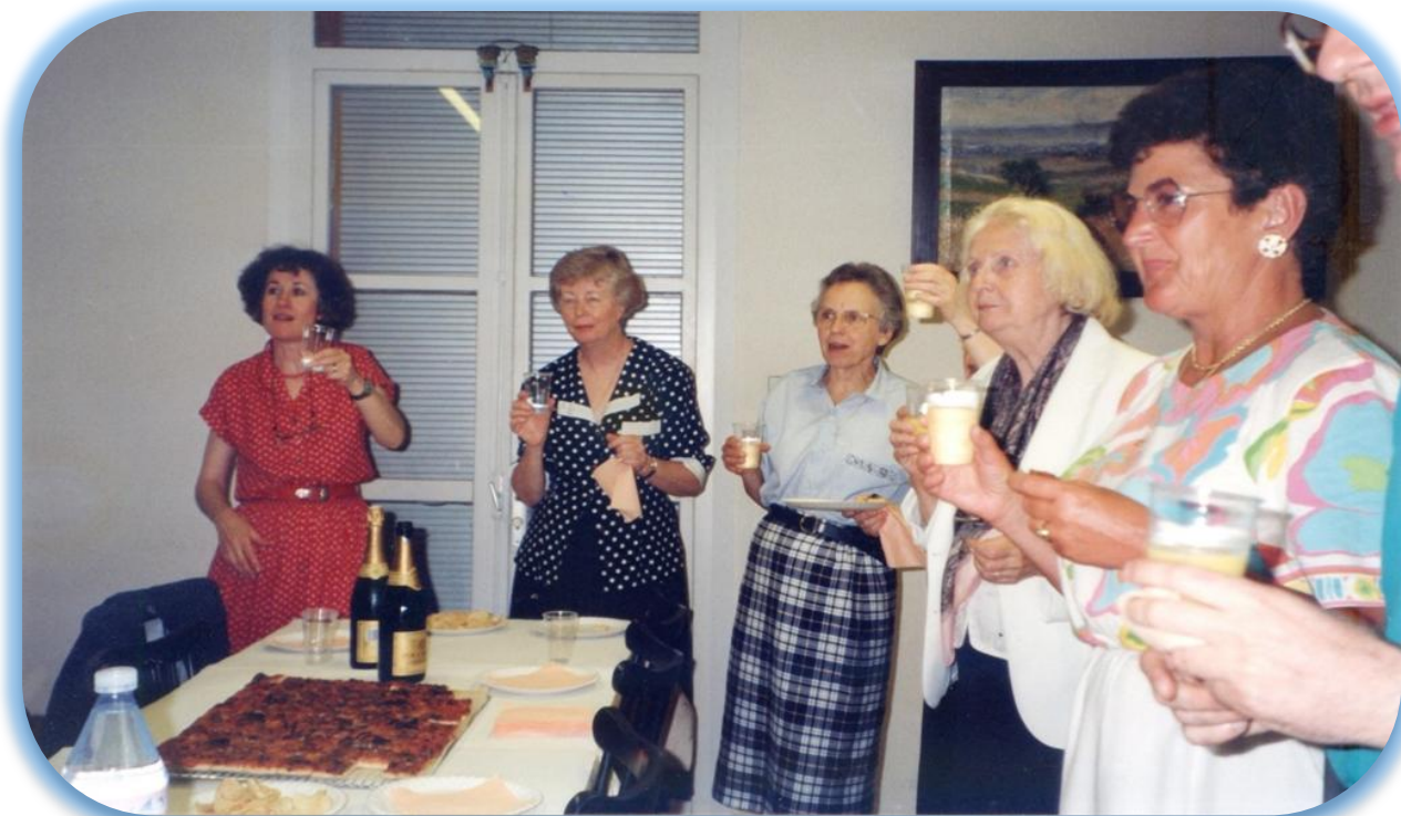
1993 – Création de l'Association ALBATROS 06 à Nice.