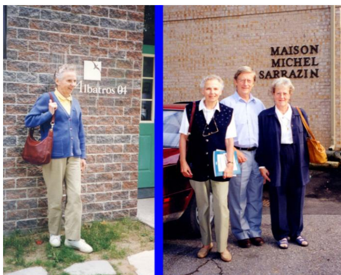
2001 – Visite au Quebec