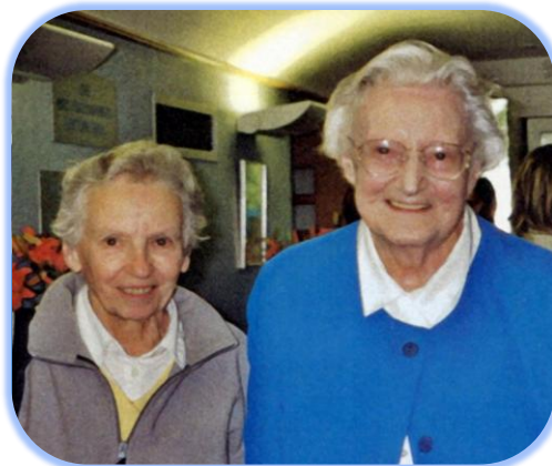
2001 – Rencontre avec Dame Cicely SAUNDERS au St Christopher Hospice de Londres.