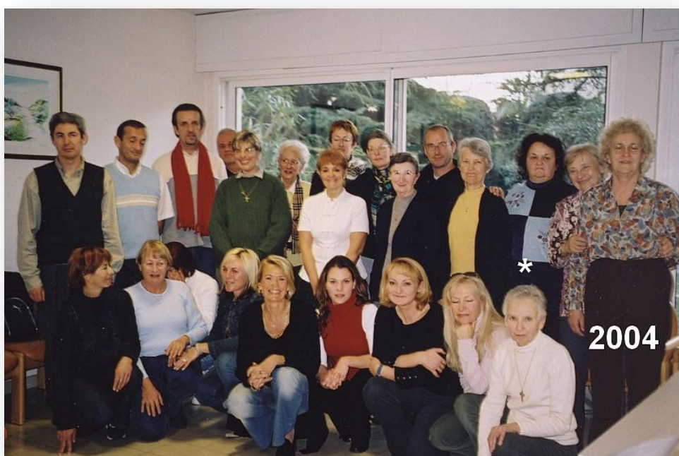
2004 - Formation Initiale