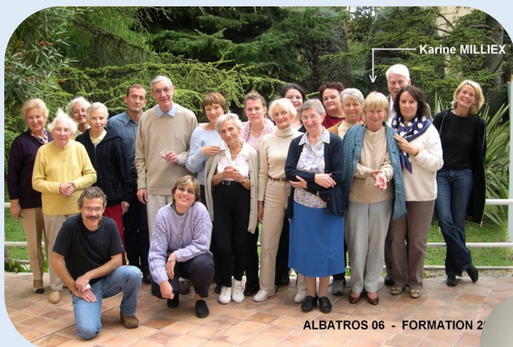
Octobre 2004 – Formation Initiale