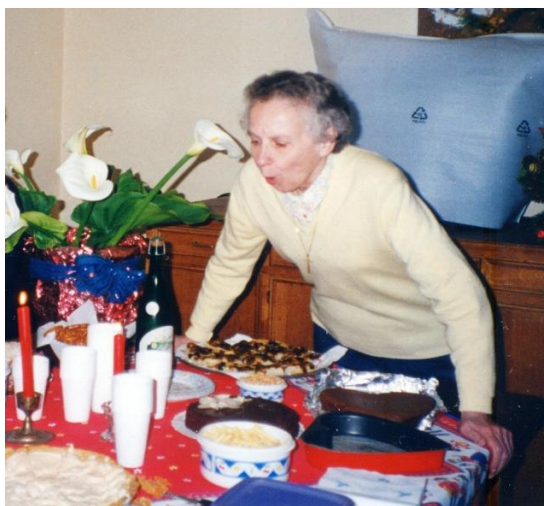
1996 – 68 e Anniversaire