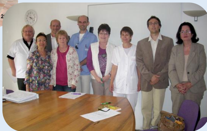
2011 - Centre Jean CHANTON - ROQUEBILLIERE