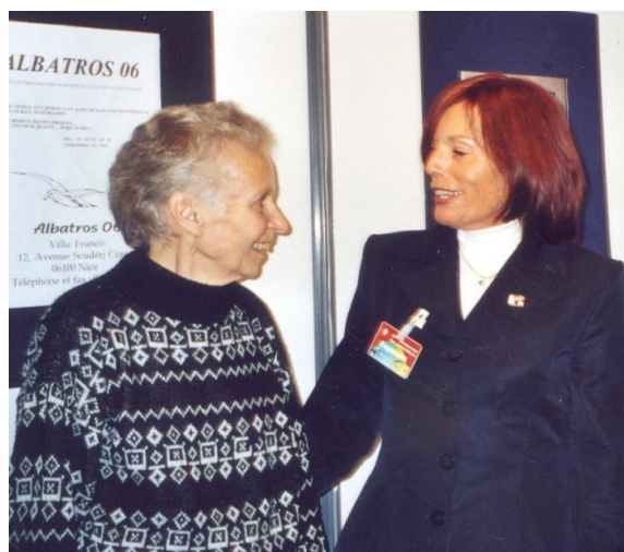
2001 - Forum des Association de Nice